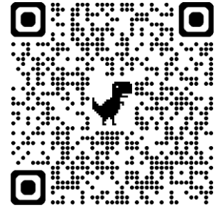
讀經進度第一季勾稽 QR-Code

2026 年一載讀經計畫已屆滿一季， 謹邀請弟兄姊妹掃描進度勾稽 QR-Code， 以線上方式實名登記您的完成進度，並加入 Line 社群， 以利後續資訊發布之週知。 至擬採紙本登記的兄姊，請於 04/05 至一樓服務台勾稽。 感謝您的參與！